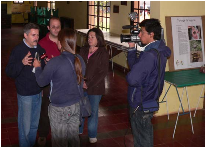
Los directores del proyecto entrevistados por el Canal 4 de Lobos y FM Lobos