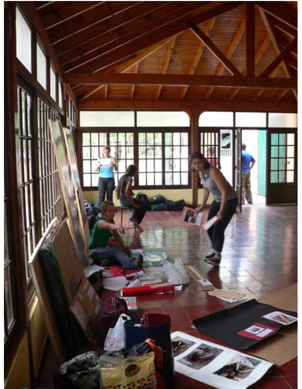
Con los paneles ya armados se comienza el montaje de la muestra