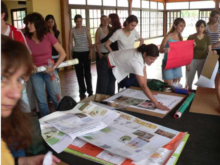
Alumnos y profesores del Instituto armando los paneles en el salón de Actos del Club de Pesca Lobos